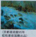
(京都美術館95年 昭和美術國際出品) 秋景 53cm X 38.5cm 520萬元