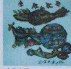
古代文明 33.5cm X 33.5cm 150萬元